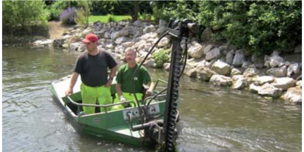
► Cet été, le bateau faucardeur sillonnera les rivières d'Artois-Lys pour empêcher la prolifération des algues et autres végétaux aquatiques.

Quant à la végétation aquatique (et tout particulièrement les algues qui se multiplient avec la pollution), elle ne pourra pas se développer démesurément grâce au passage du bateau faucardeur. Conformément à la réglementation, ce dernier ne peut sillonner les rivières d'Artois-Lys qu'à partir du 1 er juillet