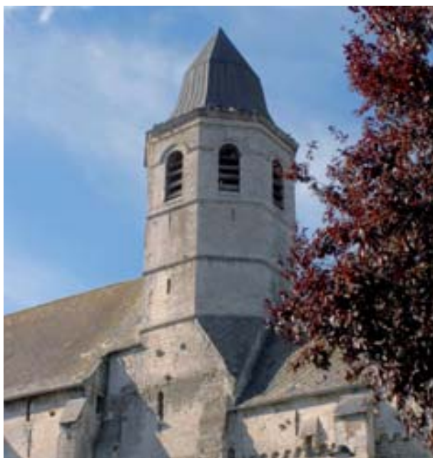
► L'église fortifiée en pierre blanche de Ames au clocher de forme octogonale (XIe-XIIe siècle).

De Amettes à Robecq, la Nave traverse cinq autres communes d'Artois-Lys, ses eaux paisibles faisant couler un flot d'histoires.