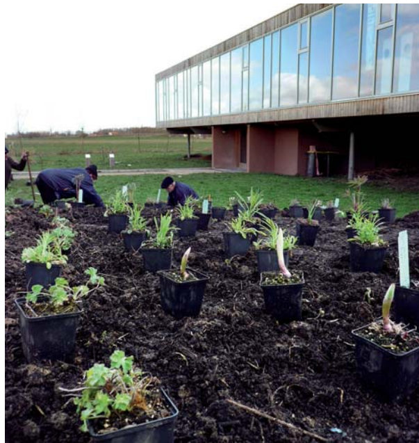
► Venez créer votre massif fleuri à Geotopia!

Depuis janvier dernier, Geotopia propose aussi des ateliers de création de jardins paysagers à thèmes : des jardiniers volontaires se perfectionnent ou s'initient à