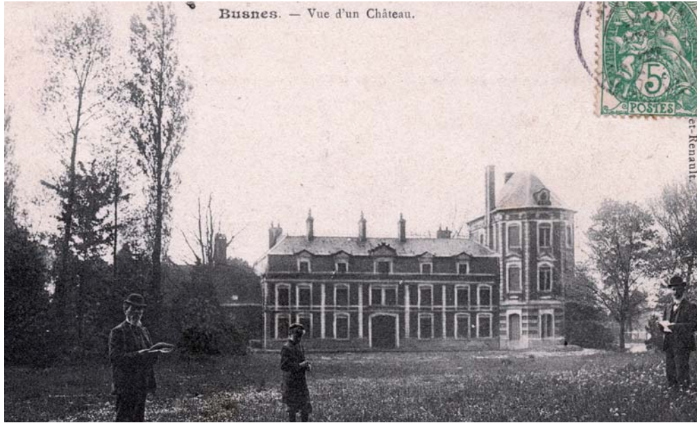
► Busnes comptait autrefois deux seigneurs et donc deux châteaux. Seul subsiste aujourd'hui celui de Beaulieu, édifié vers 1680.