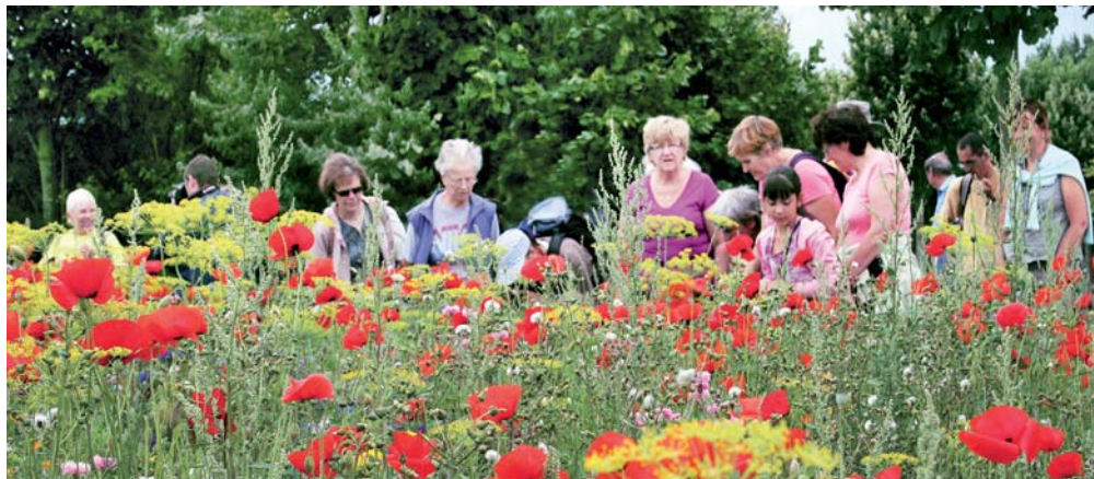
► Robinsons du mercredi, randos nocturnes, randos du jeudi, nouvelles balades Croquinature, la Via Francigena contée... profitez du programme de sorties organisé de mars à novembre sur le territoire de la Communauté Artois-Lys et du Pays de la Lys romane !

Un autre parcours devrait être prêt à accueillir les promeneurs pour la Fête du Pays, qui aura lieu le dimanche 24 avril prochain à Lespesses-Fauquenhem : le Sentier des Crêtes qui partira de ce hameau. L'aménagement des sentiers