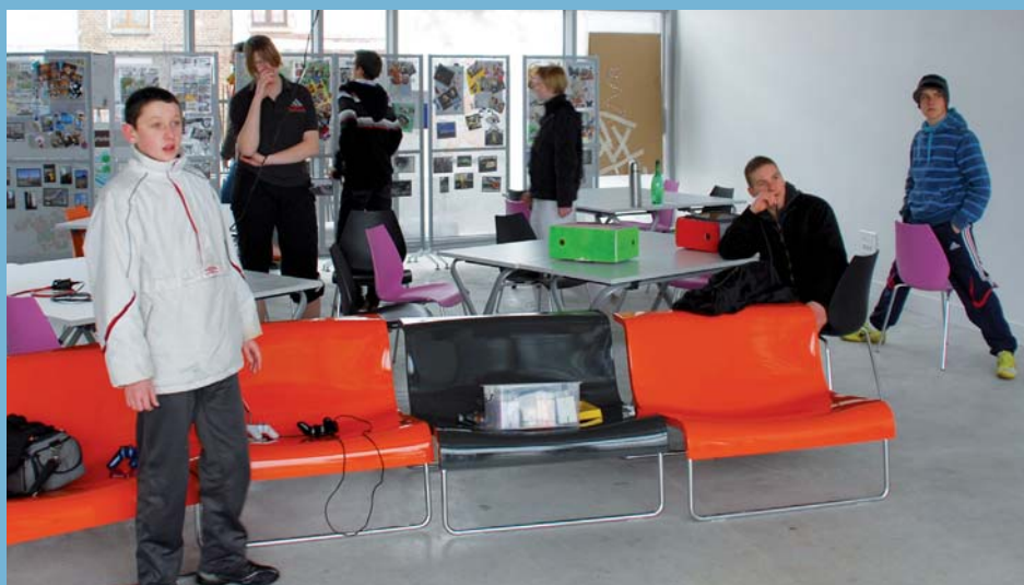
• Ils s'approprient leur nouvel espace et l'ont même décoré à l'occasion des fêtes de fin d'année.

Grâce à son tout nouveau bâtiment de la rue des Martyrs à Lillers, le Service Animation Jeunesse d'Artois-Lys propose des animations de proximité tout au long de l'année.