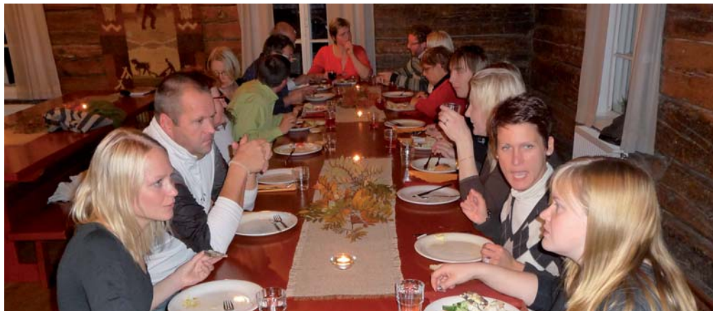
► Élus et techniciens d'Artois-Lys et d'Artois-Flandres ont rencontré leurs homologues finlandais en octobre. Ensemble, ils ont échangé, même à table, sur les coopérations possibles.

Du côté des entreprises du territoire, la coopération avec leurs homologues finlandaises ouvre de nouvelles perspectives d'échanges de savoir-faire et d'accords commerciaux. Ils pourront notamment se traduire par le développement des filières à énergies renouvelables : biogaz, éolien, bois... La Finlande dispose d'une grande expérience dans la