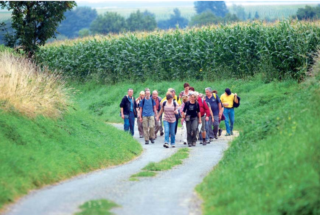
► La marche, une excellente façon d'apprécier les beautés du paysage !

Envie de promenades ? Vous allez être ravis, les chemins de randonnée ne manquent pas, d'autant que désormais deux nouveaux sentiers enrichissent l'offre de balades en Artois-Lys. La CAL offre ainsi près de 200 kilomètres de chemins balisés qui vous emmènent au cœur des plus beaux sites du territoire. Une convention a été passée avec trois associations de randonnées pédestres d'Artois-Lys. Leur mission est d'entretenir les sentiers et leur balisage pour le confort des promeneurs. Grâce à leur travail minutieux, vous pouvez emprunter, en toute confiance, l'un des douze sentiers conçus par Artois-Lys et vous laissez surprendre par les nombreuses curiosités architecturales ou paysagères des vallées