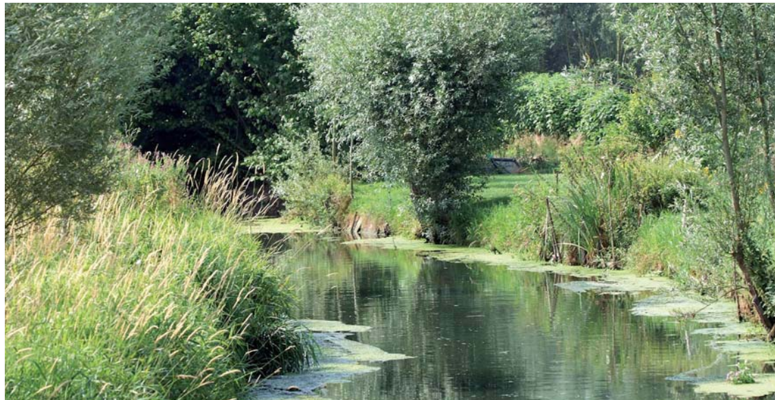
La restauration, douce et fondamentale, du Guarbecque se prépare.

L'objectif de cette étude, commencée en avril, est de définir les priorités d'action et une