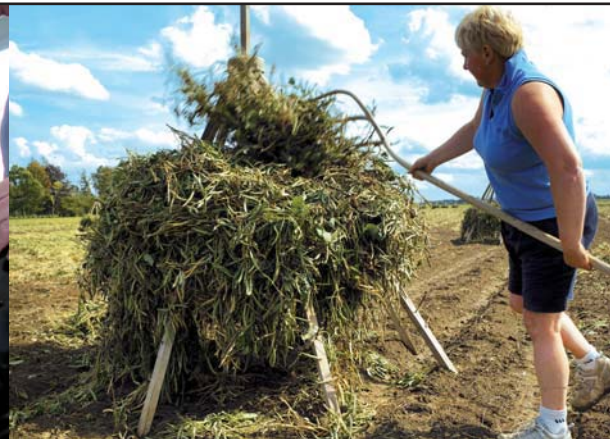
► Ci-dessus : Traditionnelle, la culture du lingot se veut respectueuse de l'environnement, tout comme la construction bois. ► Ci-contre : Les échanges européens, comme ici avec les Finlandais, sont l'occasion de présenter les richesses de notre territoire.